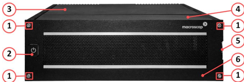
Рисунок 1. Вид спереди